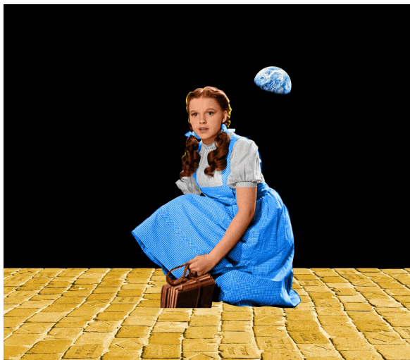
Ilustração: Alice Tassara

fábulas, mitos e contos que alimentaram as gerações anteriores para alcançar o que almeja o Novo Pacto. A construção do futuro.