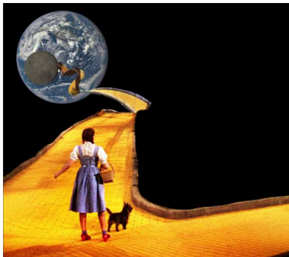
Ilustração: Alice Tassara

A amplitude das condições impostas pelo Novo Pacto, para implementá-lo, reitera-se, exige um complexo de qualidades político-atitudinais a fim de corresponder às suas exigências.