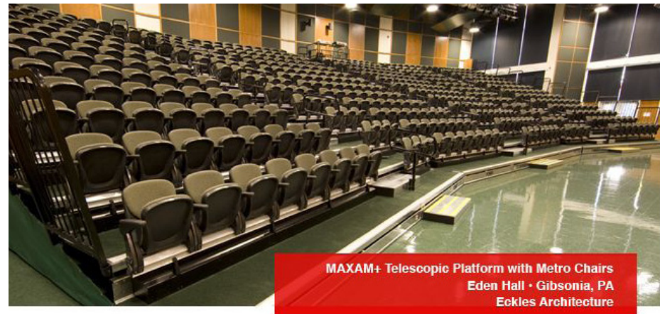
MAXAM+ Telescopic Platform with Metro Chairs Eden Hall • Gibsonia, PA Eckles Architecture