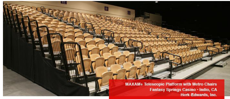
MAXAM+ Telescopic Platform with Metro Chairs Fantasy Springs Casino • Indio, CA Herk-Edwards, Inc.