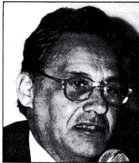
Fernando Henrique Cardoso

Em sua conferência, o senador Fernando Henrique Cardoso questionou os argumentos contrários a adoção do parlamentarismo. À alegação de que a implantação desse sistema está condicionada à existência de partidos fortes, disse que os partidos brasileiros são fracos, mas nunca se tornarão fortes no sistema atual. Todavia, "não basta adotar o parlamentarismo, é preciso também mudar o sistema eleitoral", adotando-se o voto distrital proporcional. O inverso também é válido: "Não basta mudar o sistema de voto, é preciso mudar o sistema de governo também".