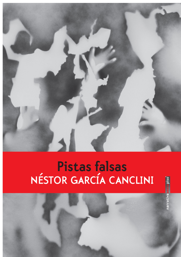
Capa da edição mexicana do livro Pistas Falsas (Editorial Sexto Piso, 2018)