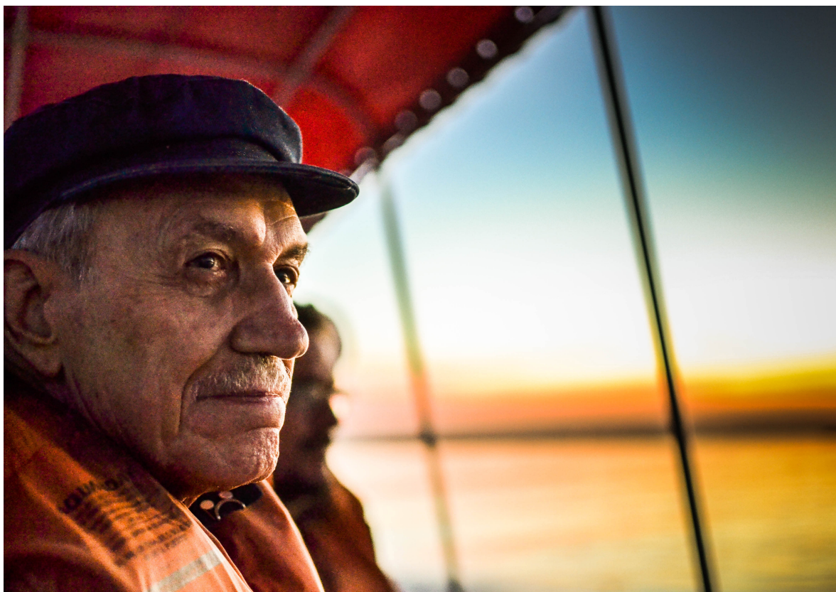
Foto de Néstor García Canclini, reproduzida na edição mexicana do livro Pistas Falsas (Editorial Sexto Piso, 2018).

A foto que veem aparece impressa na orelha da edição mexicana de Pistas Falsas 2018, livro de Néstor Canclini que escolhi para atravessar este pedaço de selva oscura na qual me encontrei ao aceitar o desafiador convite para falar nesta cerimônia, convite trazendo o risco de desviar-me da direta via – como ainda traz.