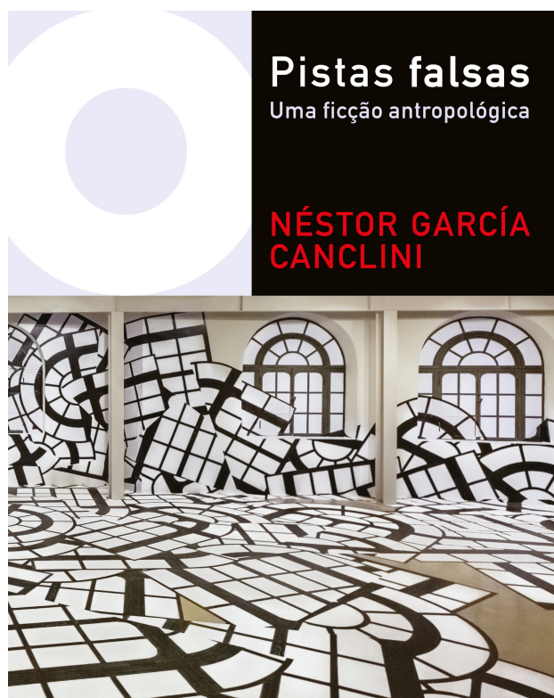
Capa da edição brasileira do livro Pistas Falsas (Instituto Itaú Cultural; Editora Iluminuras, 2020)