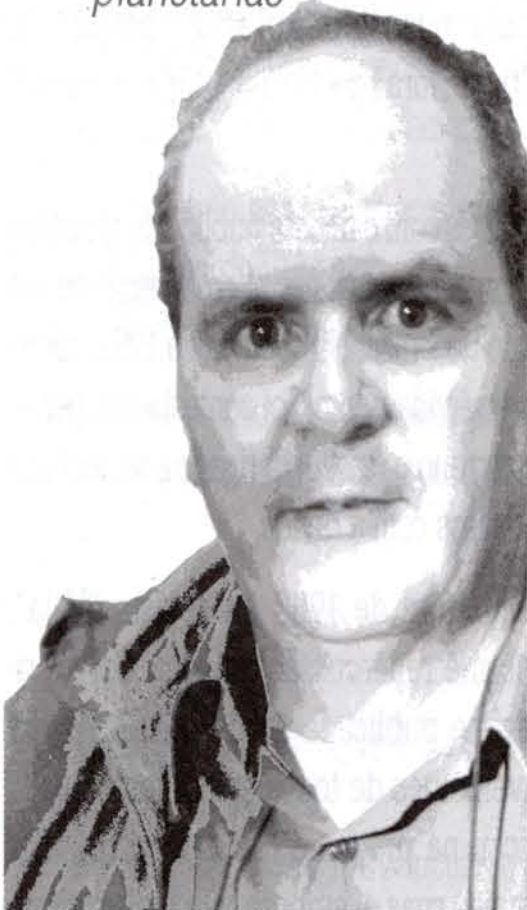
Dias: "Não existem soluções simples para algumas importantes questões ambientais"

USP sediará conferência regional sobre os avanços nas pesquisas e incertezas quanto às causas, magnitude e conseqüências das alterações ambientais planetárias