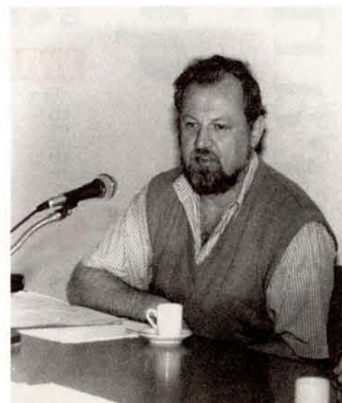
Stédile: "Renda dos agricultores caiu 46%"

grantes do MST são agricultores e 60% estudaram até o terceiro ano do primeiro grau. Nos últimos 15 anos, o MST conseguiu o assentamento de 150 mil famílias, mas "isso não é reforma agrária, é uma tentativa de resolução de um problema social".